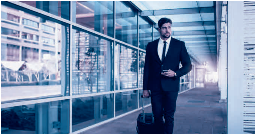
A1-Bescheinigung dabei? Sie ist für alle Aktivitäten im Ausland nötig.

entrichten hat. Es ist für sämtliche grenzüberschreitenden Tätigkeiten nötig, beispielsweise für Berater, Künstler, Journalisten oder Mitarbeiter im Transport oder Baugewerbe, und zwar auch dann, wenn der Aufenthalt nur wenige Stunden beträgt. Ausgestellt wird die A1-Bescheinigung von der AHV-Ausgleichskasse im Wohnsitzland des betroffenen Arbeitnehmers, beantragt wird sie vom Arbeitgeber des Entsandten bzw. direkt vom Selbständigerwerbenden.