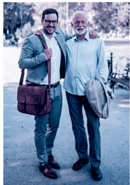
Finanzierung nach dem Umlageverfahren: zuerst einzahlen, später beziehen.